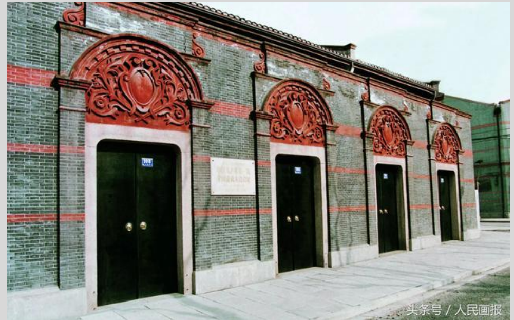
上海望志路106号（今兴业路76号）

①确定了党的名称：“中国共产党”。②明确了党的奋斗目标：推翻资产阶级，建立无产阶级专政，实现社会主义和共产主义。③选举产生党的领导机构，陈独秀任书记。