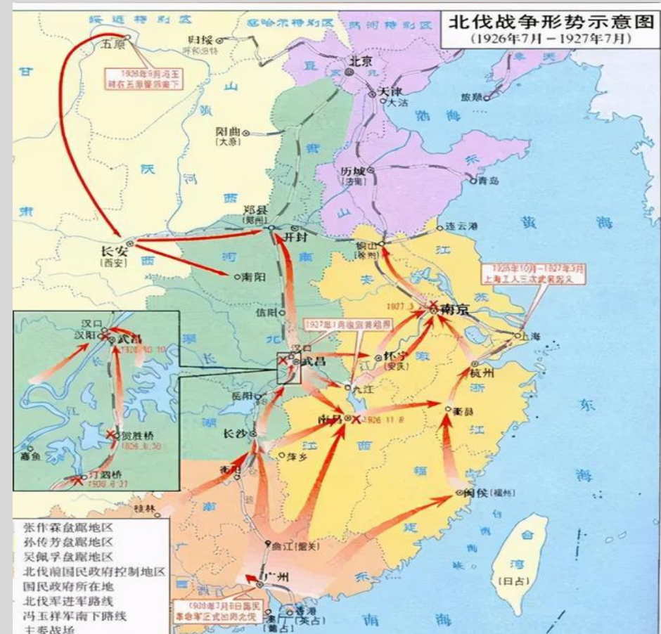
国民革命军北伐路线示意图